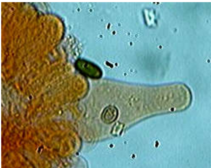
Pleurocystide x 1000 (dans le congo)