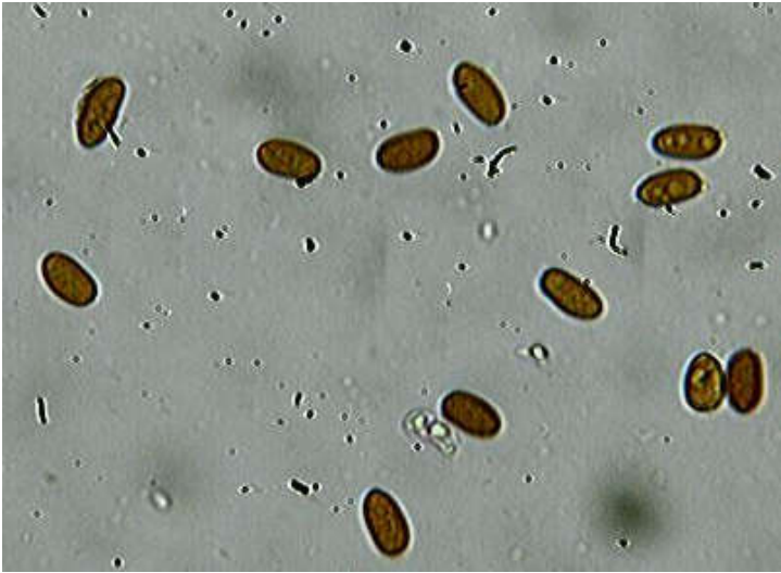
Spores x 400 (dans l'eau)