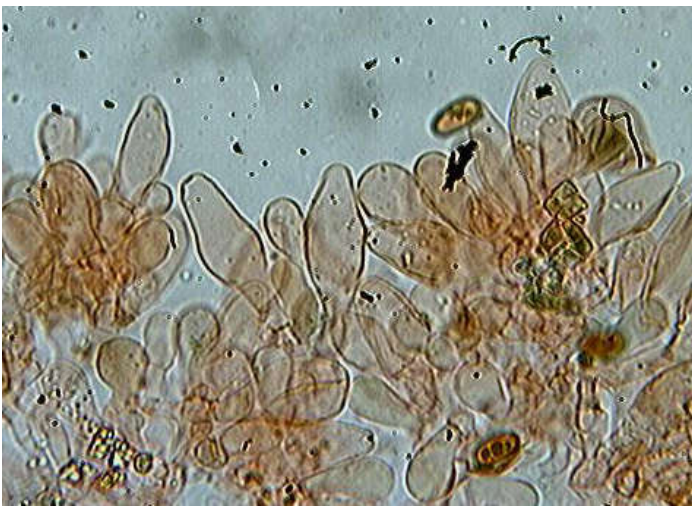
Cheilocystides (dans la phloxine)