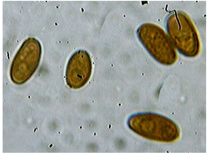
Spores x 1000 (dans l'eau)